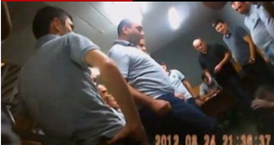
Georgien: Folter-Debatte vermasselt Präsident Saakaschwili den Wahlkampf