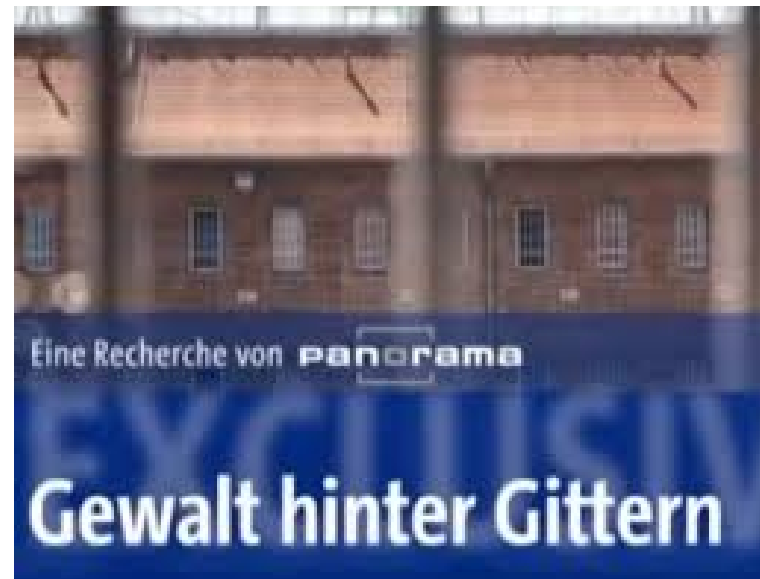
Gewalt hinter Gittern - Neue Doku von 2013 - Mißhandlungen in Deutschen Gefängnissen

Videos mit brutalen Szenen aus georgischen Gefängnissen sorgen für Massenproteste. Es hagelt Kritik aus Europa, der Innenminister ist zurückgetreten.