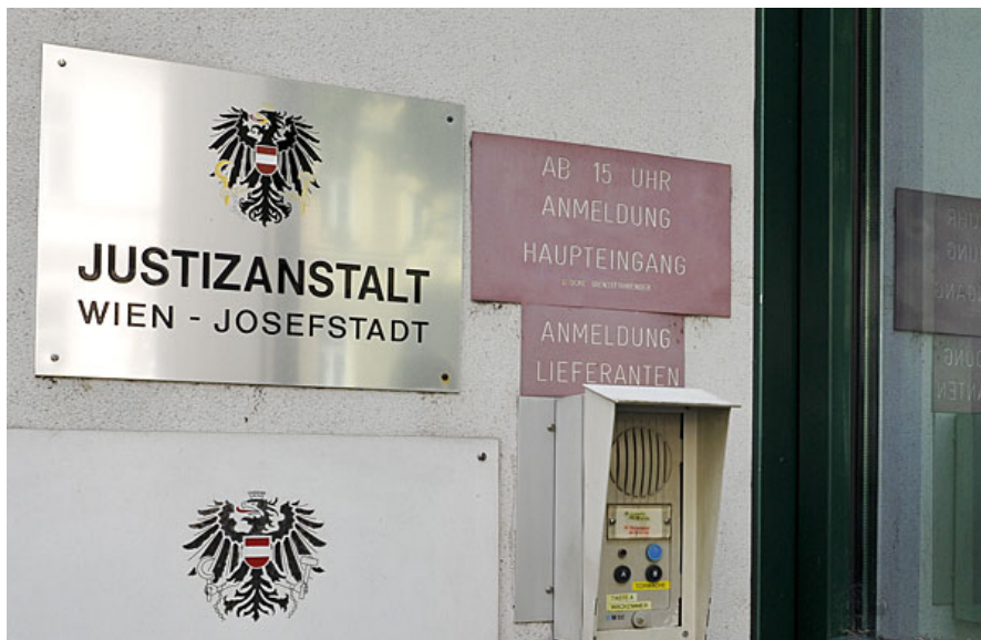
“Folter” im Gefängnis: Vergewaltigung und Nötigung im Jugendstrafvollzug